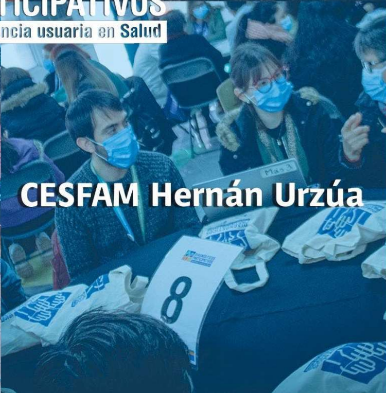
CESFAM Hernán Urzúa